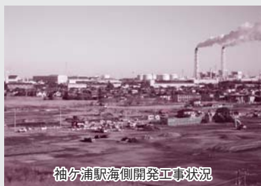
袖ヶ浦駅海側開発工事状況

口増で公共施設も必要になる。税収の根拠が見えない。市税収入の見込みをどう見ているか。