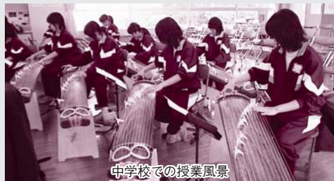
中学校での授業風景

A 県が沿道の地権者調査を行い、11月に地権者の方々に対して、説明会が実施されるなど歩道整備の具体化に向けて前進しています。市としても通学する児童の安全確保のために歩道の早期整備を県に強く要望していきます。