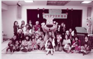
ファミリーサポートセンター ガウラクくんを囲んで、メリークリスマス!

A 子育て親子交流の場や育児相談の場、子育て団体やNPO等の活動拠点の場、世代間交流の場など、保育所送迎ステーション等を併設した施設です。