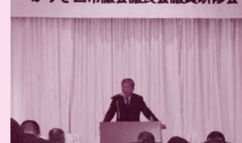
1月18日 かずさ四市議会議長 会議員研修会