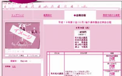
映像部分のフルスクリーン表示もできます。