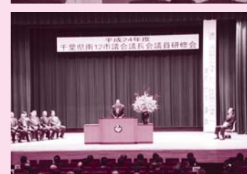
1月24日 千葉県南12市議会 議長会議員研修会